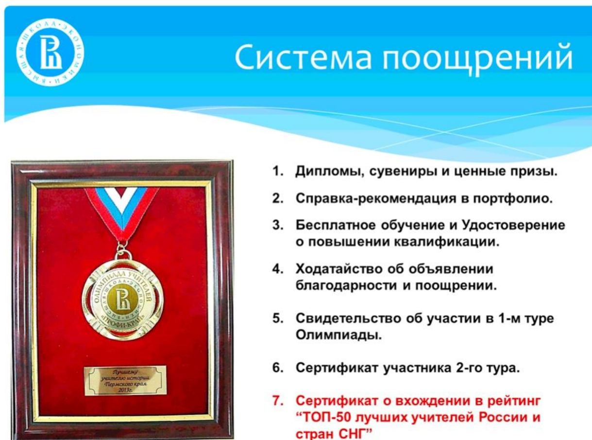
Рисунок 2. Система поощрения участников, победителей и призеров Олимпиады

Методика проведения Олимпиады постоянно совершенствуется, и сейчас уже можно говорить о массовом многопрофильном инновационном продукте на рынке образования, спрос на который предъявляется всеми участниками образовательного процесса в сфере среднего общего, среднего профессионального и даже высшего образования.