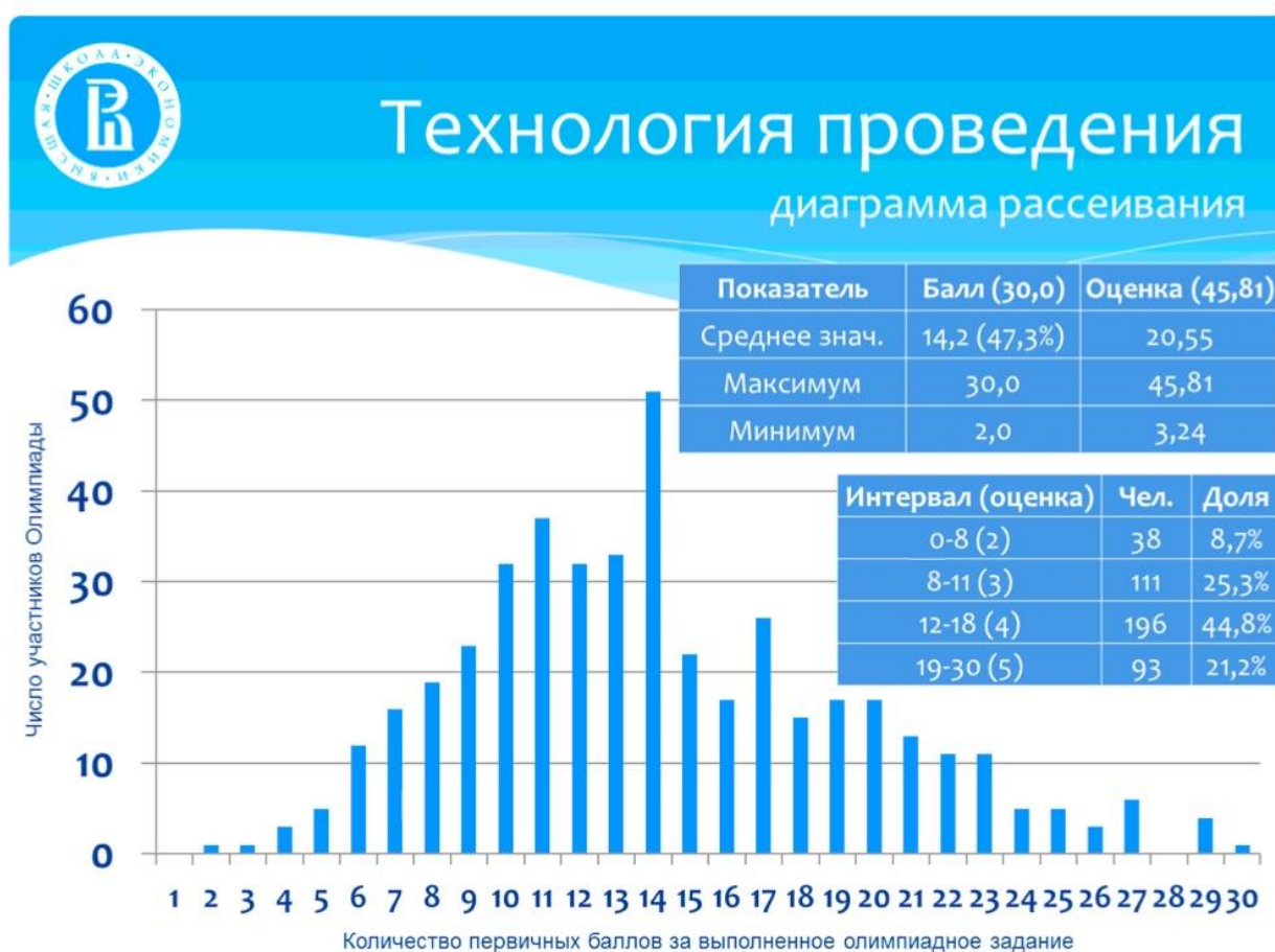
Рисунок 3. Диаграмма результативности

На рис. 3 отражена частота появления отдельных возможных значений и доказано, что набор заданий для Олимпиады подобран практически идеально, т.к. диаграмма довольно близка к нормальному распределению: каждый столбец – это количество участников, выполнивших работу на указанное на горизонтальной шкале баллов.