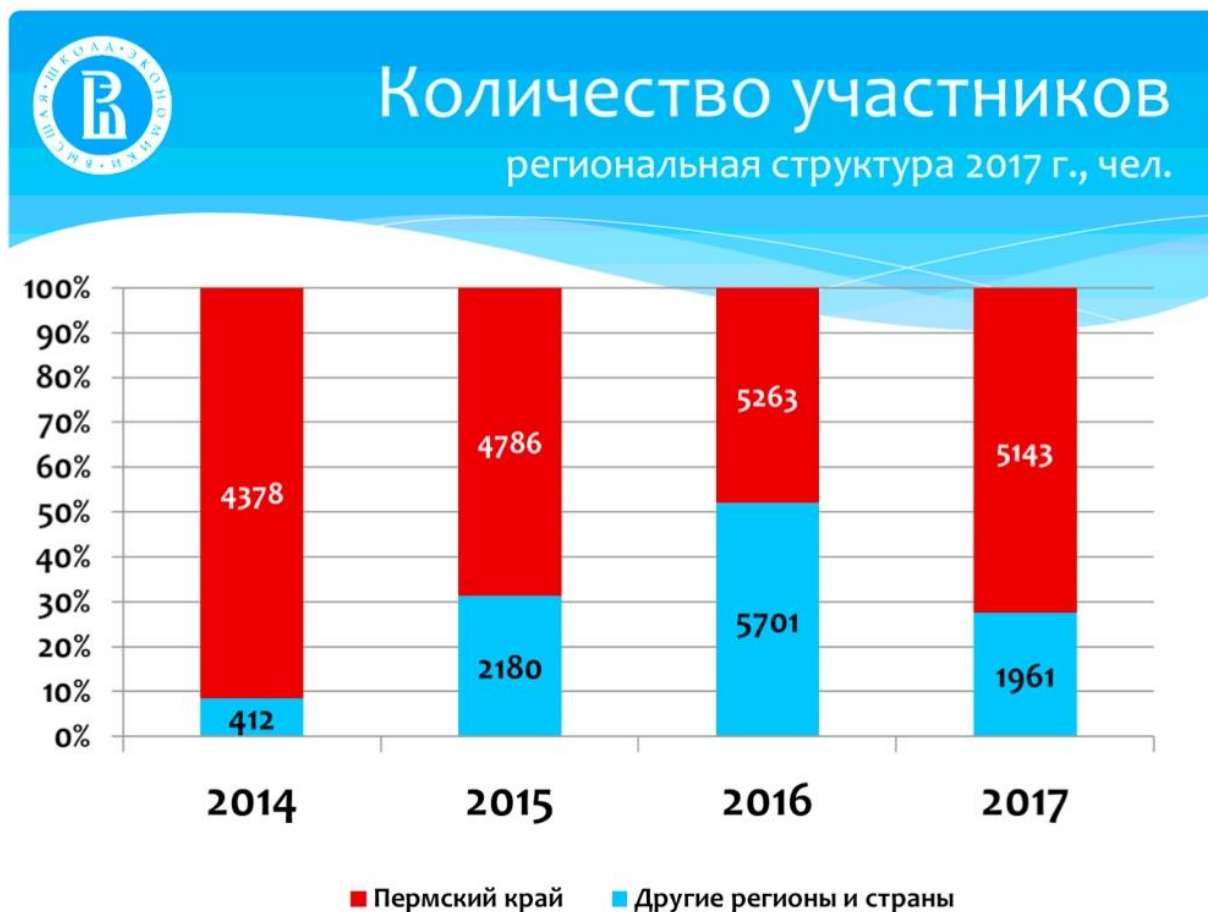
Рисунок 8. Динамика количества участников в разбивке по территории

Уже сегодня можно говорить о том, что проект получил признание в других регионах Российской Федерации и странах ближнего зарубежья. Однако количество участников из других субъектов федерации до сих пор гораздо меньше по сравнению с Пермским краем (рис. 8).