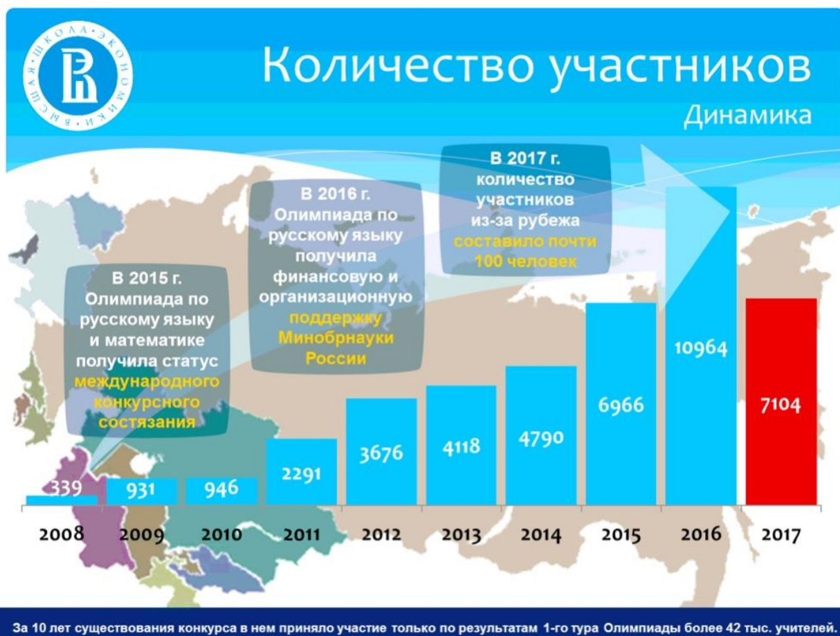
Рисунок 1. Динамика количества участников