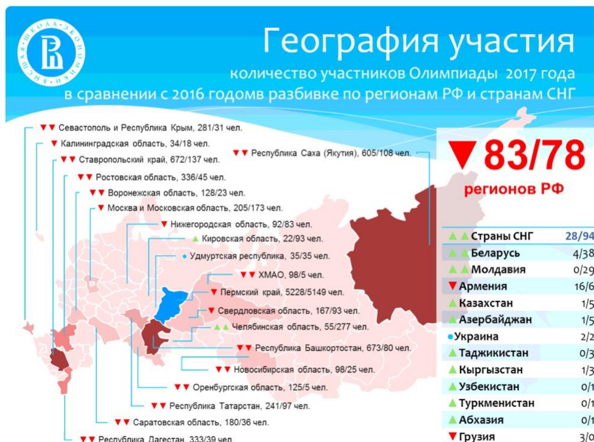
Рисунок 7. География участия в Олимпиаде